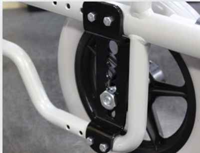
Réglage de l'essieu arrière