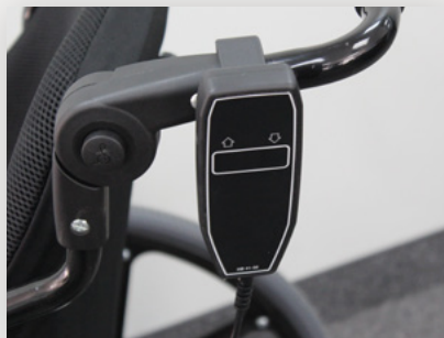
Option d'inclinaison électrique