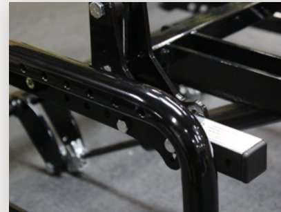
Réglage de l'essieu arrière