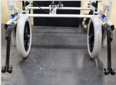
Configuration étroite (Montage de la roue intérieure)