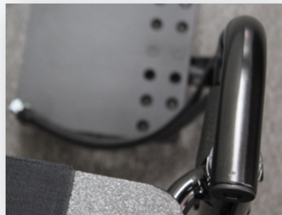
Pivot central pivotant dans le gréement avant