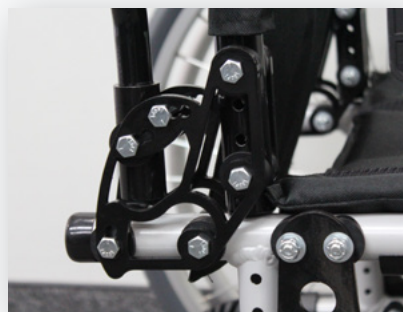
Cannes dorsales à angle réglable 0 °, 5 °, 10 ° ou 15 °