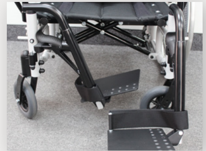
Swing In et Swing Out Front Gréement