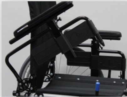
Bras à deux points