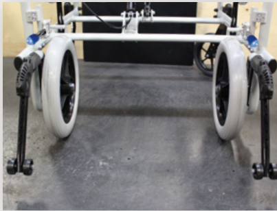
Configuration étroite (Montage de la roue intérieure)