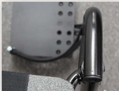
Pivot central pivotant dans le grèement avant (Optionnel)