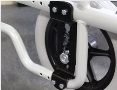
Réglage de l'essieu arrière